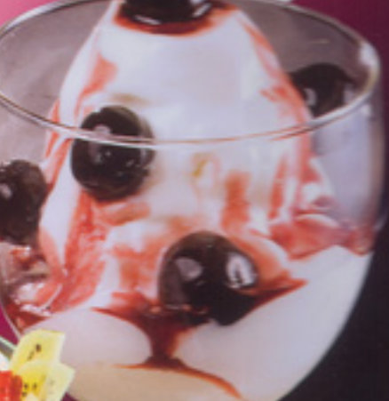
28 Joghurt Amarena 1 Joghurteis, Joghurt, Amarenakirschen und Amarenasoße € 4,20