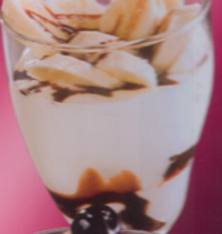
Joghurt Banane Joghurteis, Joghurt, Bananeneis, frische Erdbeersoße oder weiße Schokosoße € 4,20