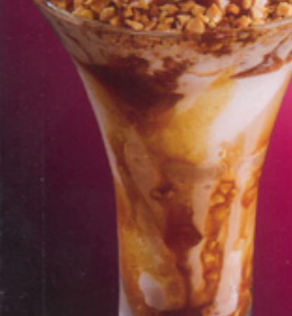
41 Tartufoteller 1 Schoko- und Nusseis, Sahne, Schokostreusel, Kirschlikör, Schokosoße, Kakaopulver € 4,30