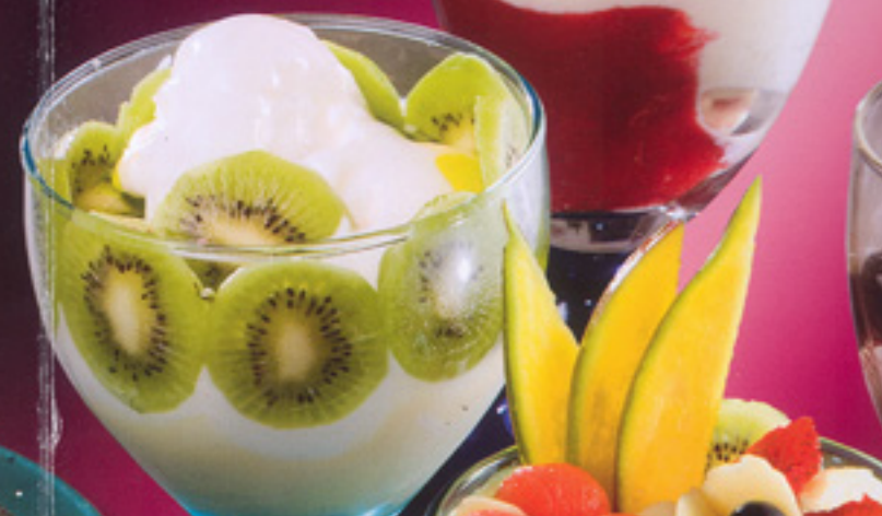
29 Joghurt Kiwi Joghurteis, Joghurt, frische Kiwistücke, Kiwisoße € 4,10