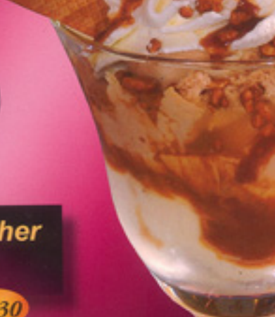
49 Tiramisu-Becher Vanilleeis, Tiramisueis, Tiramisusoße, Kakaopulver, Sahne, Löffelbiscuit € 3,70