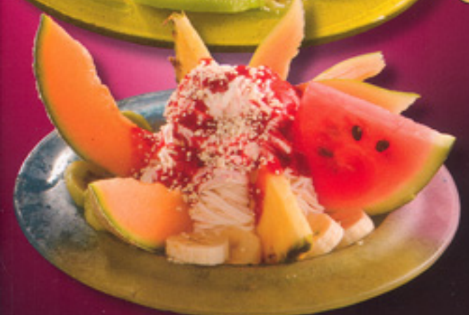
16 Spaghetti Spezial Sahne, Vanilleeis, Erdbeersoße, weiße Schokoraseln und frische Früchte € 4,60