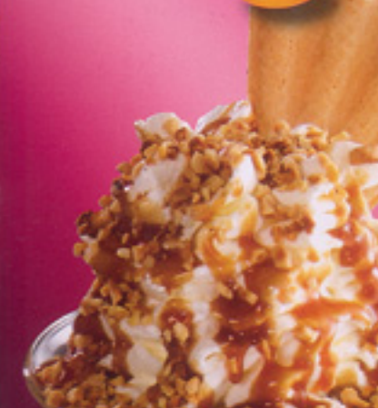
37 Nuss-Becher Vanille- und Nusseis, Nusssoße, Sahne und Krokantstreusel € 3,60