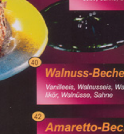
42 Amaretto-Becher Vanille- u. Amarettoeis, Amarettoликör, Sahne, Amarettini-Kekse € 4,10