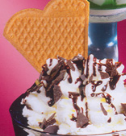
39 Schoko-Becher Vanille- und Schokoeis, Schokosoße, Sahne, Schokoladenstreusel € 3,60