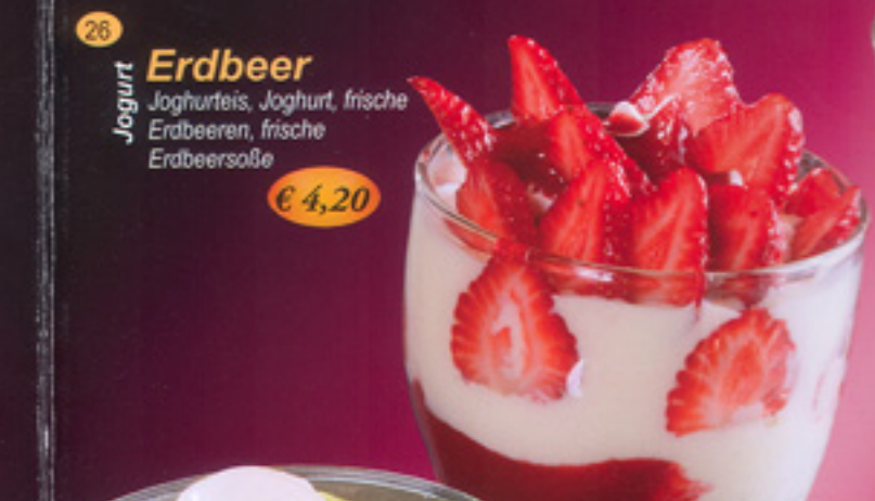
26 Joghurt Erdbeer Joghurteis, Joghurt, frische Erdbeeren, frische Erdbeersoße € 4,20