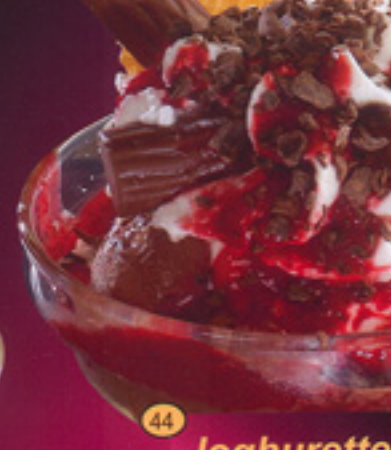
44 Joghurette-Becher gem. Eis, Sahne, Joghurette, Erdbeersoße und Schokostreusel € 4,20