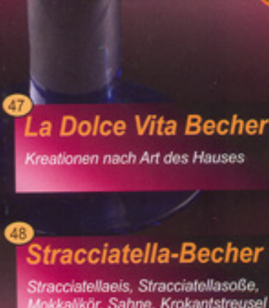
48 Stracciatella-Becher 8 Stracciatellaeis, Stracciatellasoße, Mokkalikör, Sahne, Krokantstreusel € 4,10