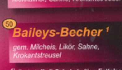
50 Baileys-Becher 1 gem. Milcheis, Likör, Sahne, Krokantstreusel € 3,90