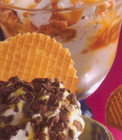
45 Eierlikör-Becher Vanilleeis, Eierlikör, Sahne und Schokoladenstreusel € 4,30