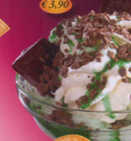
38 After Eight-Becher 1 Vanille- und Pfefferminzeis, Pfefferminzsoße, Sahne, Schokostreusel After Eight Tafelchen € 3,90