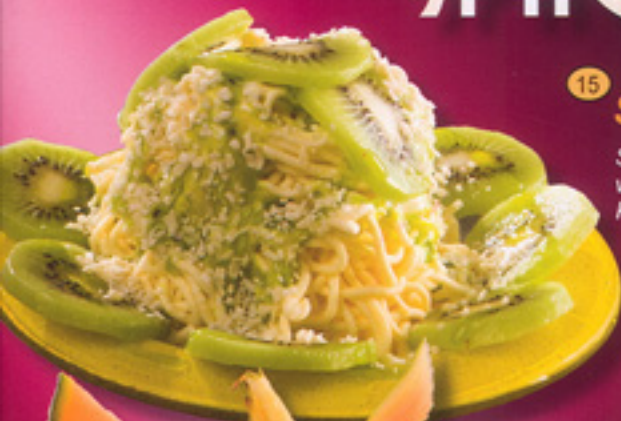
15 Spaghetti Kiwi Sahne, Vanilleeis, Kiwisoße, weiße Schokoraseln u. frische Kiwis € 4,10