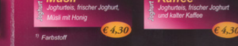
34 Joghurt Müsli Joghurteis, frischer Joghurt, Müsli mit Honig € 4,30