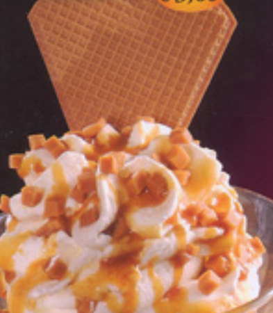
43 Karamell-Becher gem. Milcheis, Karamelloße, Sahne, Krokantstreusel € 3,60