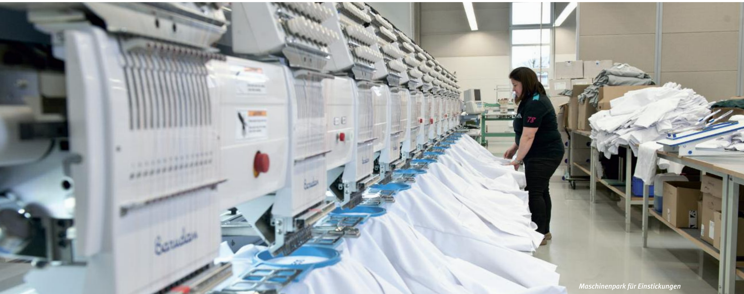
Maschinenpark für Einstickungen

„Ein einheitliches Erscheinungsbild schafft Vertrauen. Corporate Fashion gehört heute dazu“