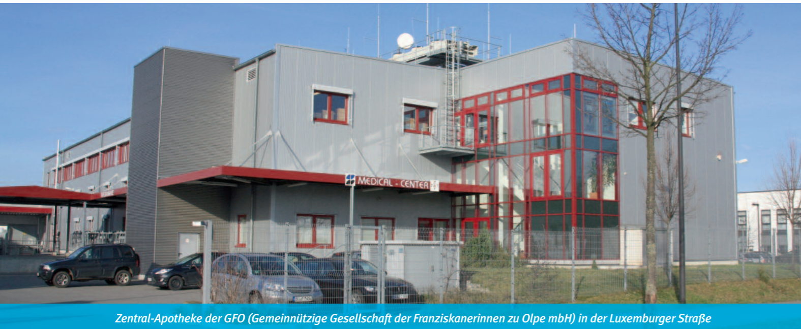
Zentral-Apotheke der GFO (Gemeinnützige Gesellschaft der Franziskanerinnen zu Olpe mbH) in der Luxemburger Straße

Die Gesundheitswirtschaft ist für Troisdorf ein bedeutender und wachsender Wirtschaftszweig. Rund 170 Freiberufler und Unternehmen mit mehr als 3.000 Mitarbeitern, die direkt aus dieser Branche stammen, sind in Troisdorf ansässig. Neben Ärzten und Apotheken fallen auch verschiedenste Unternehmen in diesen Wirtschaftszweig, die unterschiedlich eng mit den Themen Gesundheit und Medizin verbunden sind. Mit zwei großen Krankenhäusern, einer Vielzahl von Ärzten aus verschiedenen Fachbereichen sowie vielen Apotheken weist Troisdorf ein überaus gutes Versorgungsangebot für die Bürger auf. Gleiches gilt auch für den Pflegebereich.