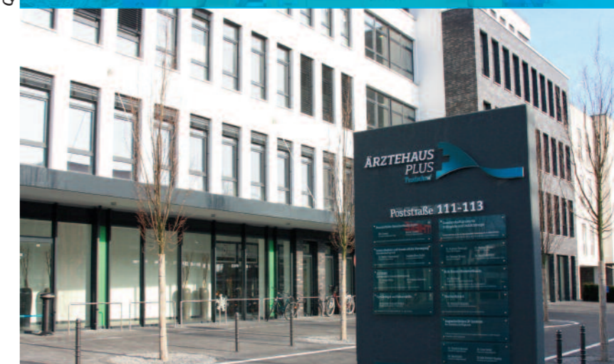
ÄrztehausPlus Troisdorf an der Poststraße