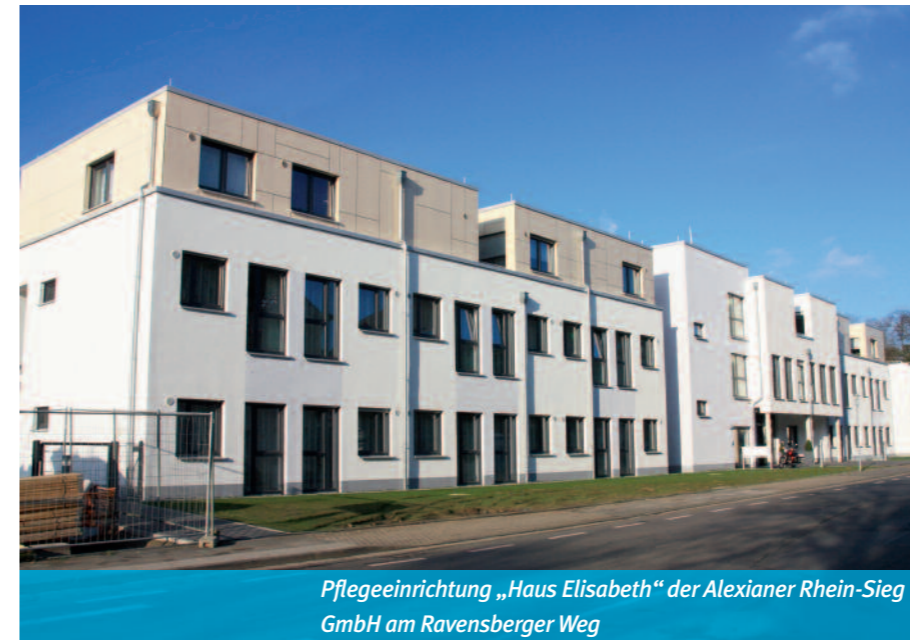
Pflegeeinrichtung „Haus Elisabeth“ der Alexianer Rhein-Sieg GmbH am Ravensberger Weg

Ein Ziel der TROWISTA ist es, diese gute Situation auch weiterhin zu sichern und zu fördern. Um dies zu gewährleisten, ist eine stärkere Berücksichtigung dieses Sektors bei den Veranstaltungen und Publikationen geplant. Gespräche mit Multiplikatoren aus dieser Branche sorgen hier für eine gründlichere Betrachtungsweise